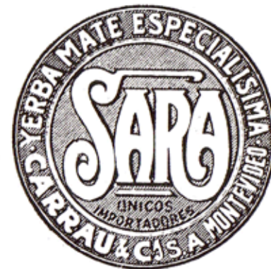
Logotipo de yerba Sara, circa 1918, anónimo.

En tapa: ilustración inédita, Hermengildo Sábat, técnica mixta, 1992